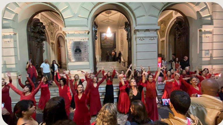
Grupo Gesto dança Sandra Rosa Madalena, em homenagem a Sidney Magal, em frente ao CCJF pouco antes da exibição do filme

Mais do que exibições de filmes, as sessões de junho do Cinelândia - Cinema na Rua proporcionaram experiências que integraram diferentes linguagens artísticas e aproximaram o público da cultura em um espaço aberto e democrático.